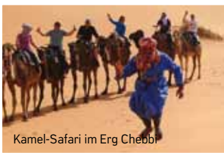
Kamel-Safari im Erg Chebbi

14-tägige Rundreise in das abwechslungsreichste und sicherste Land Nordafrikas – das Königreich Marokko! In die „blaue Stadt“ Chefchaouen. Über das Rifgebirge, den Mittleren Atlas und die Schlucht des Oued Ziz in den Saharaort Merzouga. Zu den Schluchten des Hohen Atlas. In die Königsstadt Marrakesch mit Stadtbesichtigung. Zur Atlantikfestung Essaouira und über Casablanca nach Tanger an der Straße von Gibraltar.