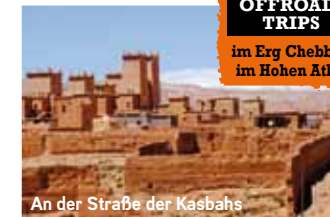
An der Straße der Kasbahs

Für Endurofahrer gibt es zwei OFFROAD- TRIPS im Erg Chebbi + im Hohen Atlas