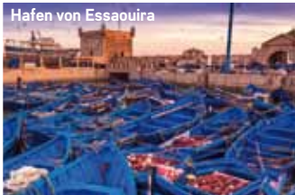
Hafen von Essaouira