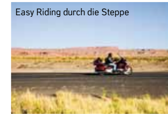
Easy Riding durch die Steppe