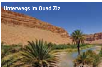
Unterwegs im Oued Ziz