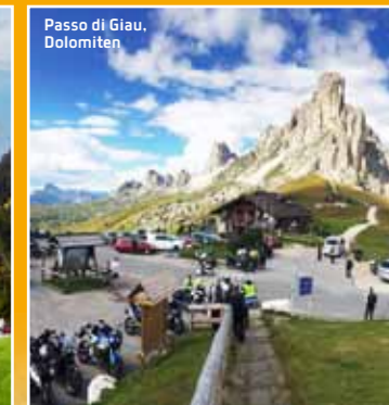
Passo di Giau, Dolomiten